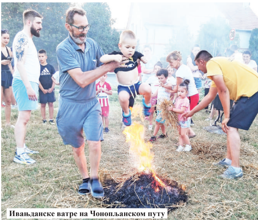
Ивањданске ватре на Чонопљанском путу