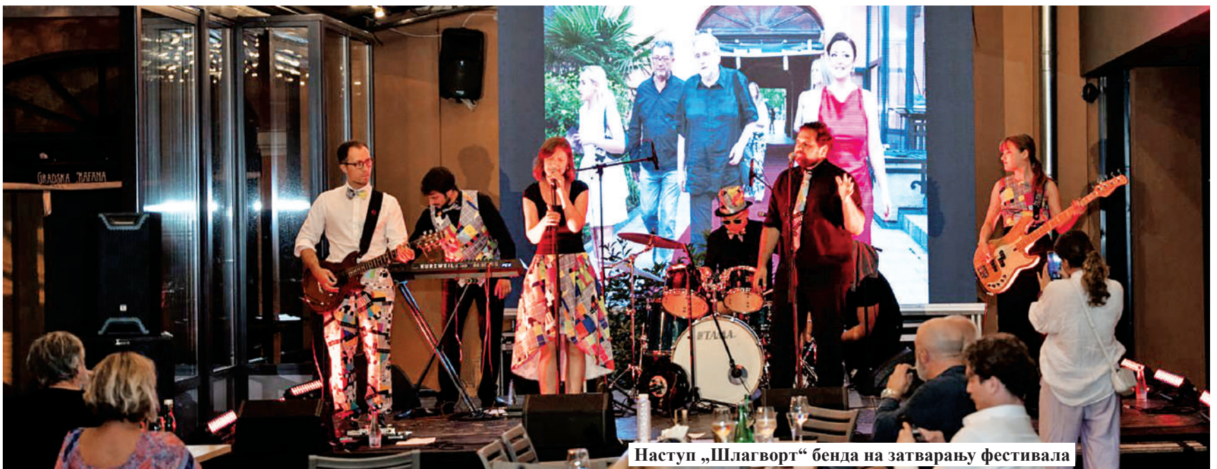
Наступ „Шлагворт“ бенда на затварању фестивала