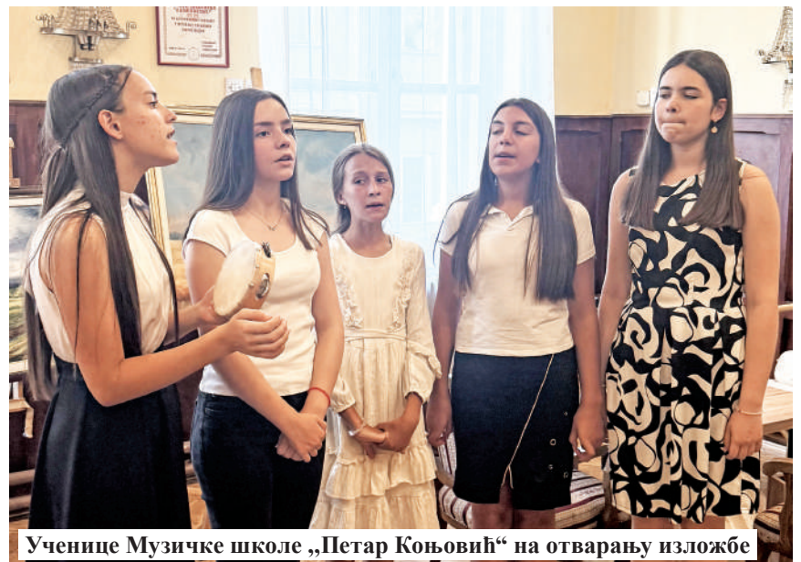
Ученице Музичке школе „Петар Коњовић“ на отварању изложбе