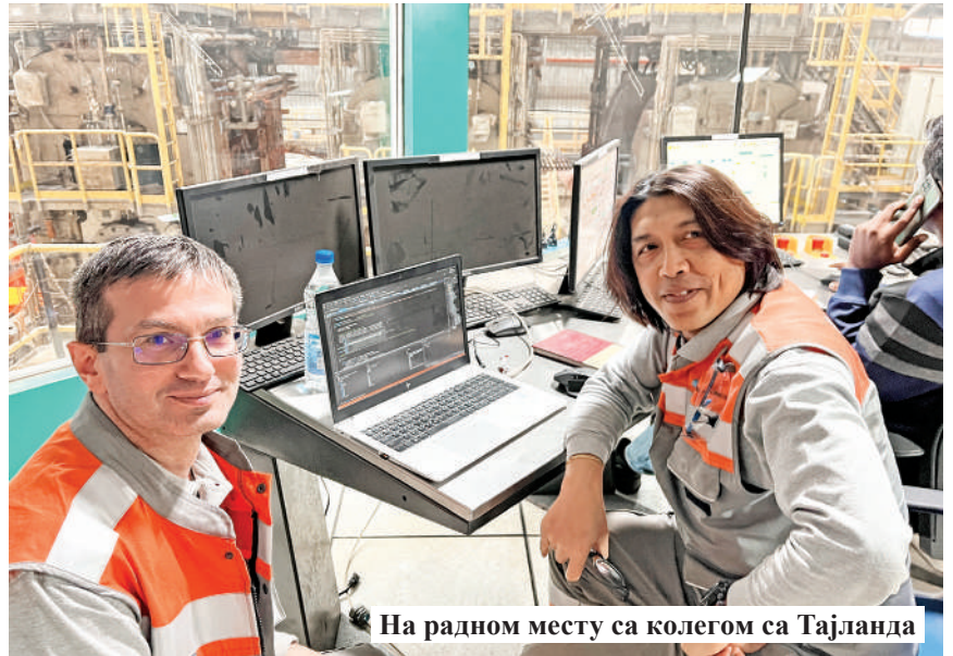
На радном месту са колегом са Тајланда