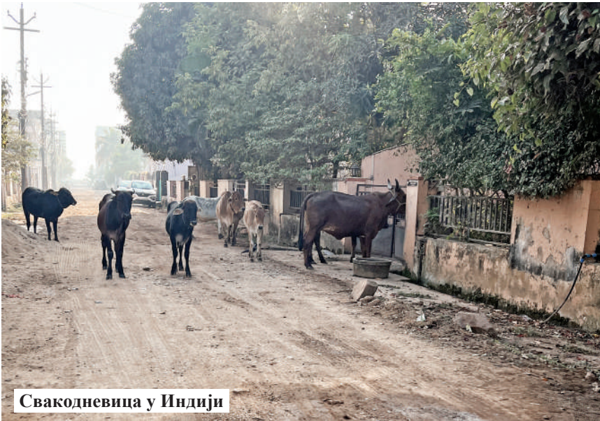
Свакодневица у Индији