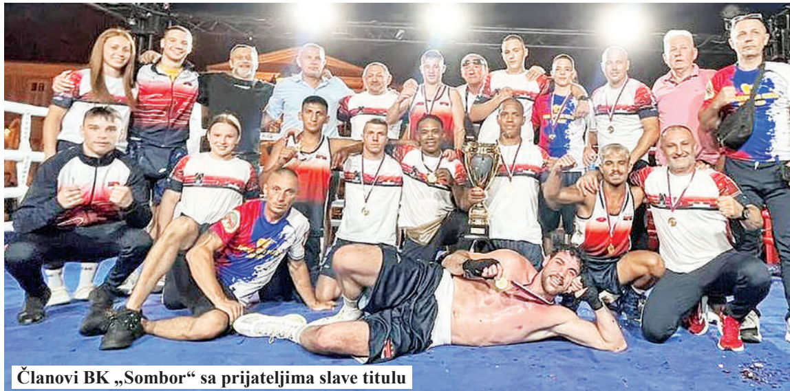
Članovi BK „Sombor“ sa prijateljima slave titulu

Domaći bokseri su izuzetno motivisano ušli u meč za titulu, rešeni da pred svojom publikom