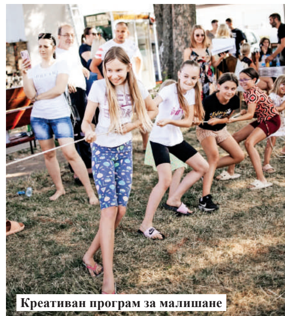
Креативан програм за малишане