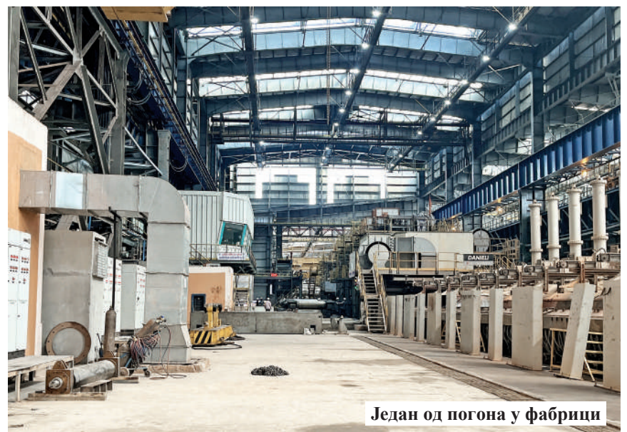
Један од погона у фабрици

Пројекат „Обични људи – необичне приче“ подржао је Покрајински секретаријат за културу, јавно информисање и односе са верским заједницама. Ставови изнети у подржаном медијском пројекту нужно не изражавају ставове органа који је доделио средства