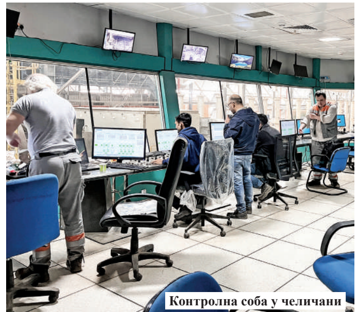
Контролна соба у челичани