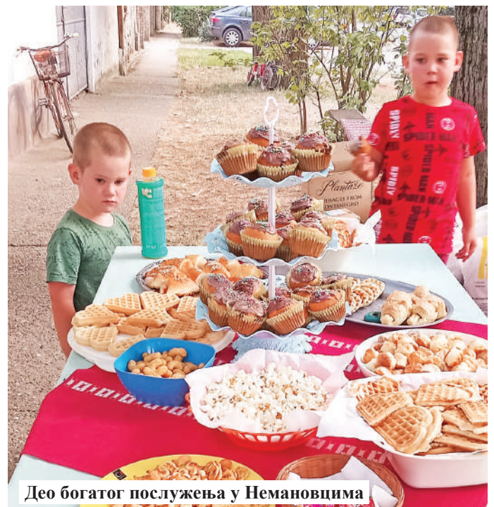
Део богатог послужења у Немановцима

пљанском путу било је такође весело, а ватра се палила уз музику и богато послужење. Као и сваке године, и у насељу Гоге на неколико места гореле су ивањданске ватре, које су уз много смеха и радости прескакали и стари и млади. Лепота празника, обичаја и дружења у Сомбору је и ове године била у првом плану, а ова лепа традиција је на тај начин настављена и сачувана. М. Р.