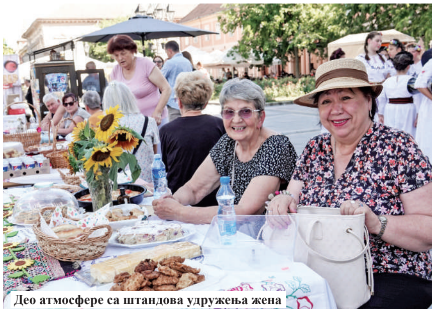
Део атмосфере са штандова удружења жена