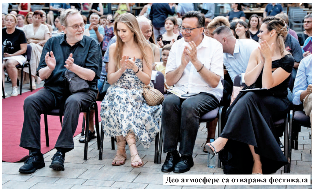
Део атмосфере са отварања фестивала

отворио врата најмлађима, у оквиру предфестивалског програма приказан је дечији филм „Планета 7693“ редитеља