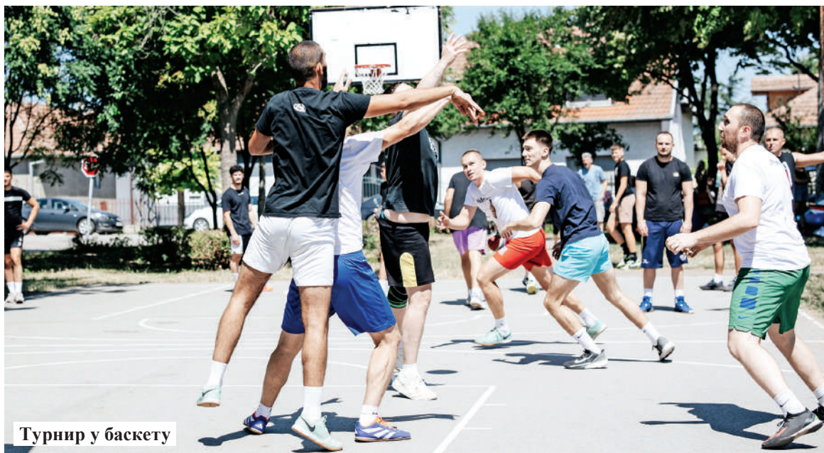
Турнир у баскету