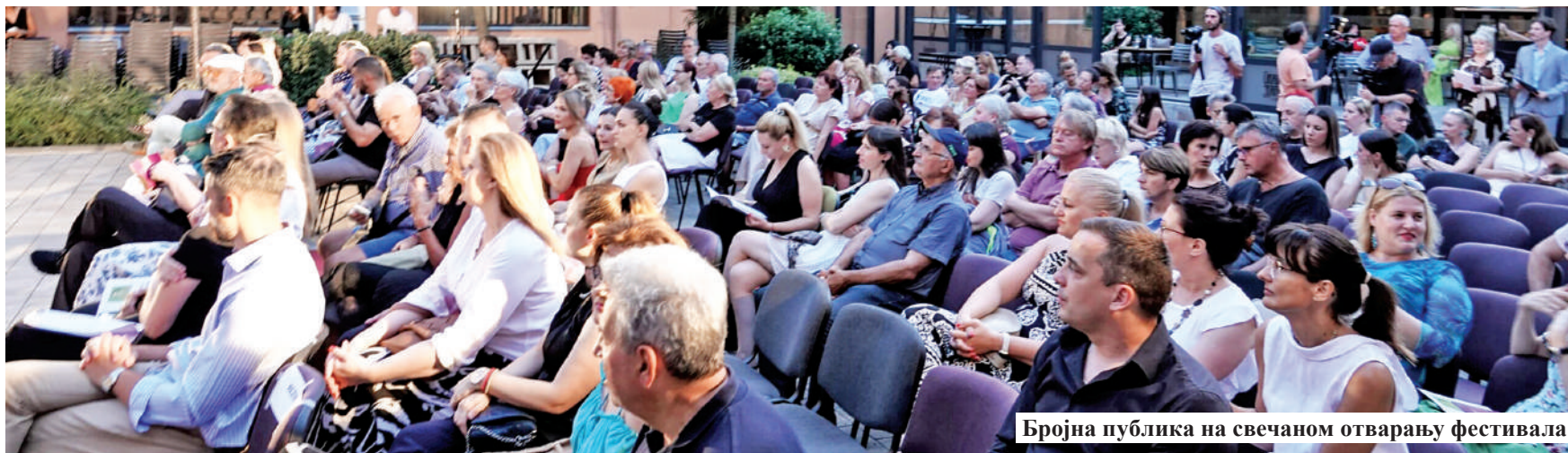
Бројна публика на свечаном отварању фестивала