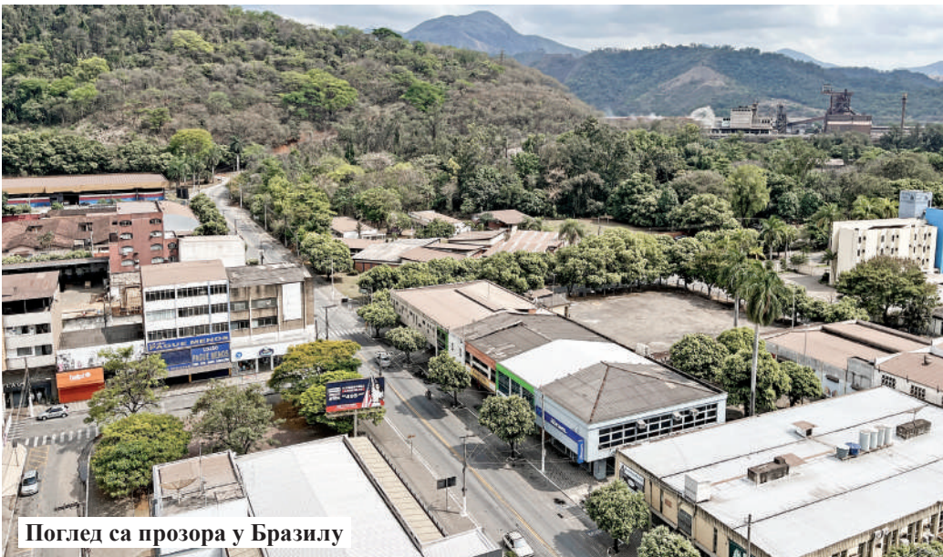
Поглед са прозора у Бразилу

месеца и за то време упознао је индијску културу, обичаје и навике.