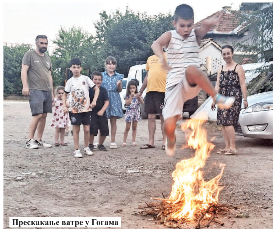
Прескакање ватре у Гогама