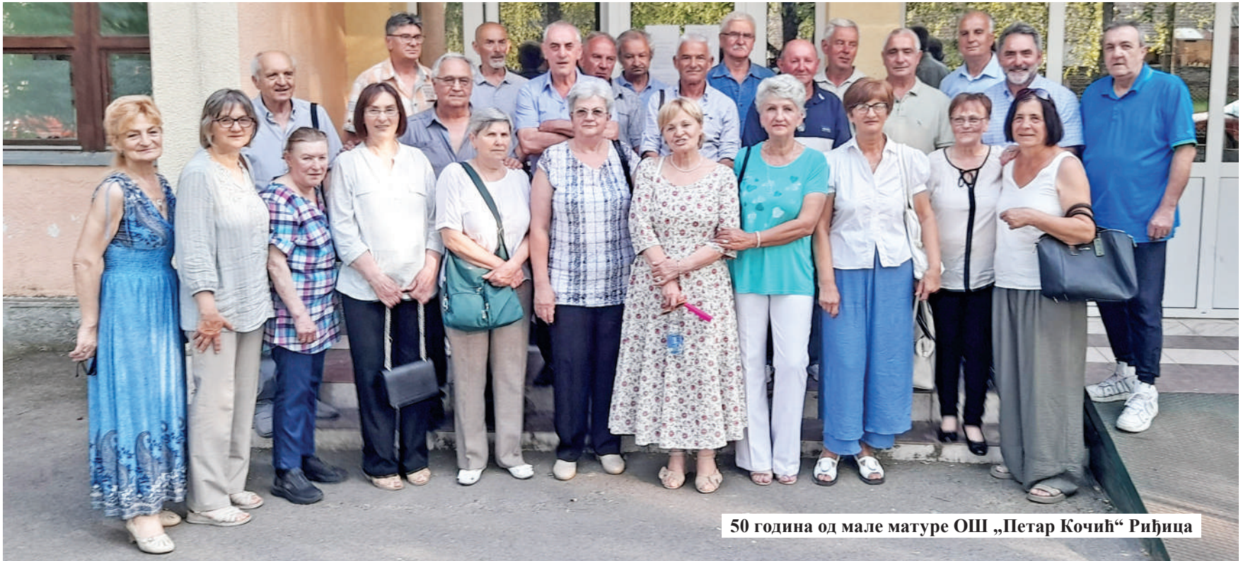
50 година од мале матуре ОШ „Петар Кочић“ Риђица