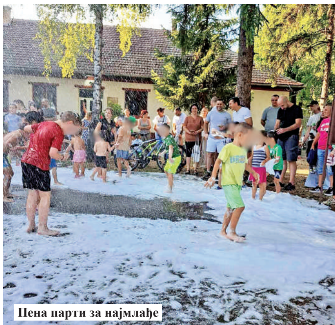
Пена парти за најмлађе