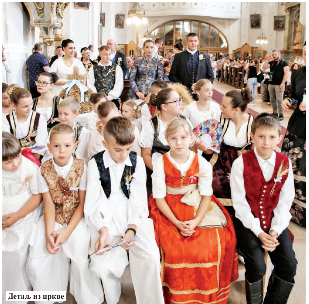
Детаљ из цркве