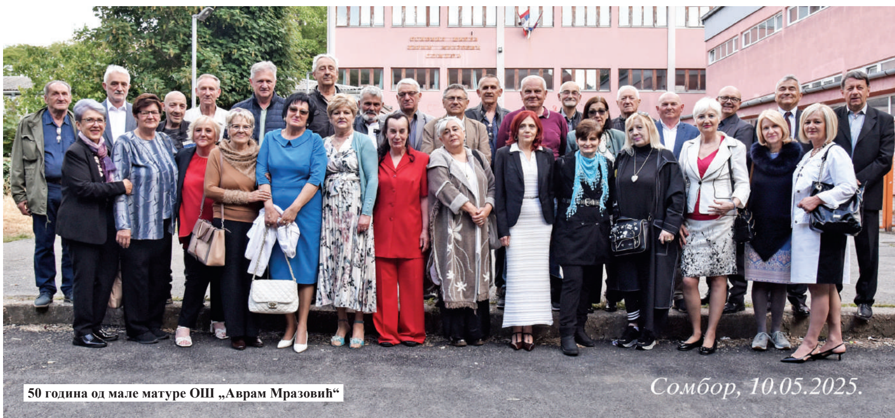
50 година од мале матуре ОШ „Аврам Мразовић“