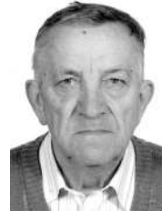
FRANJA PAP FERIKA