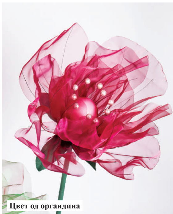
Цвет од органдина