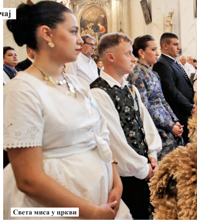
Света миса у цркви