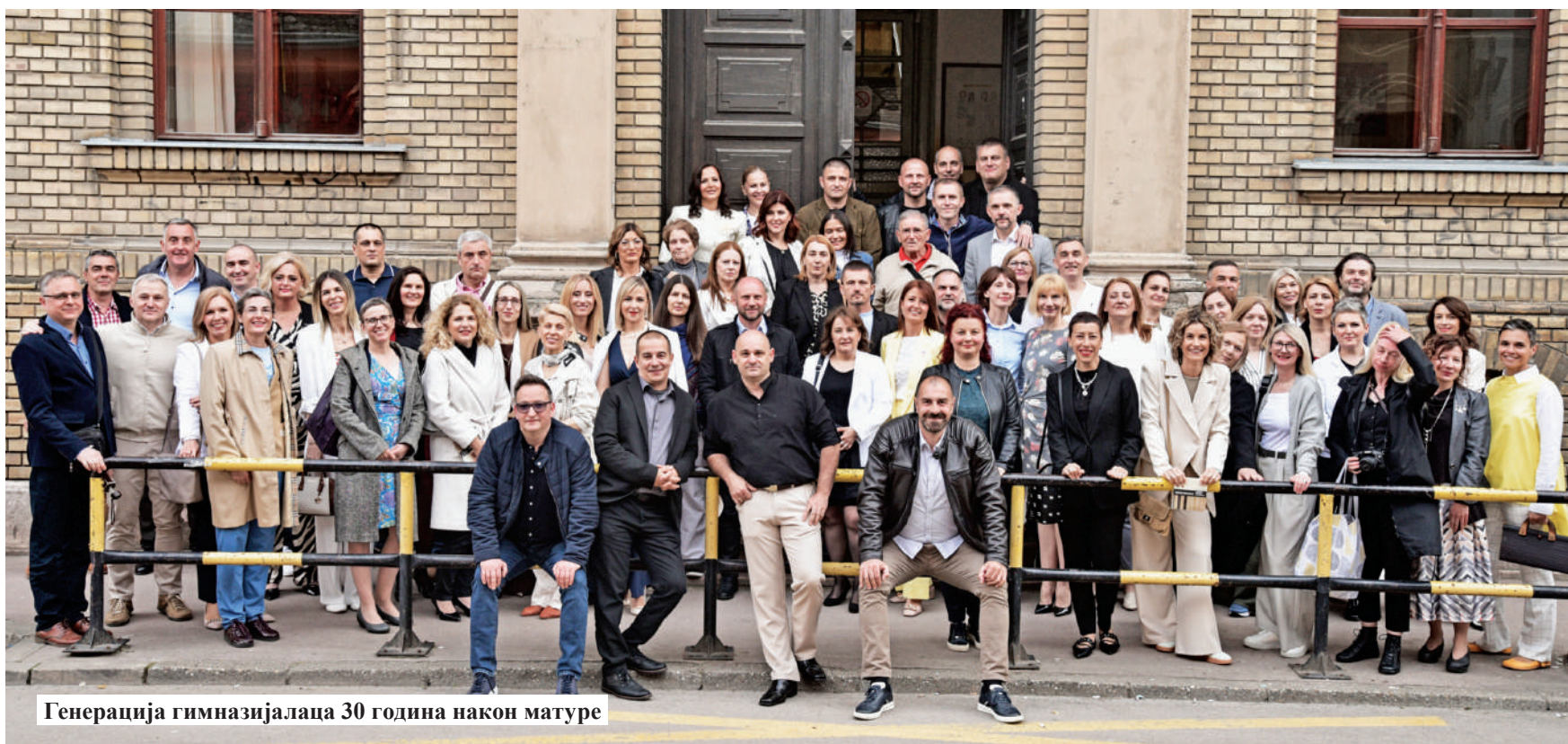
Генерација гимназијалаца 30 година након матуре