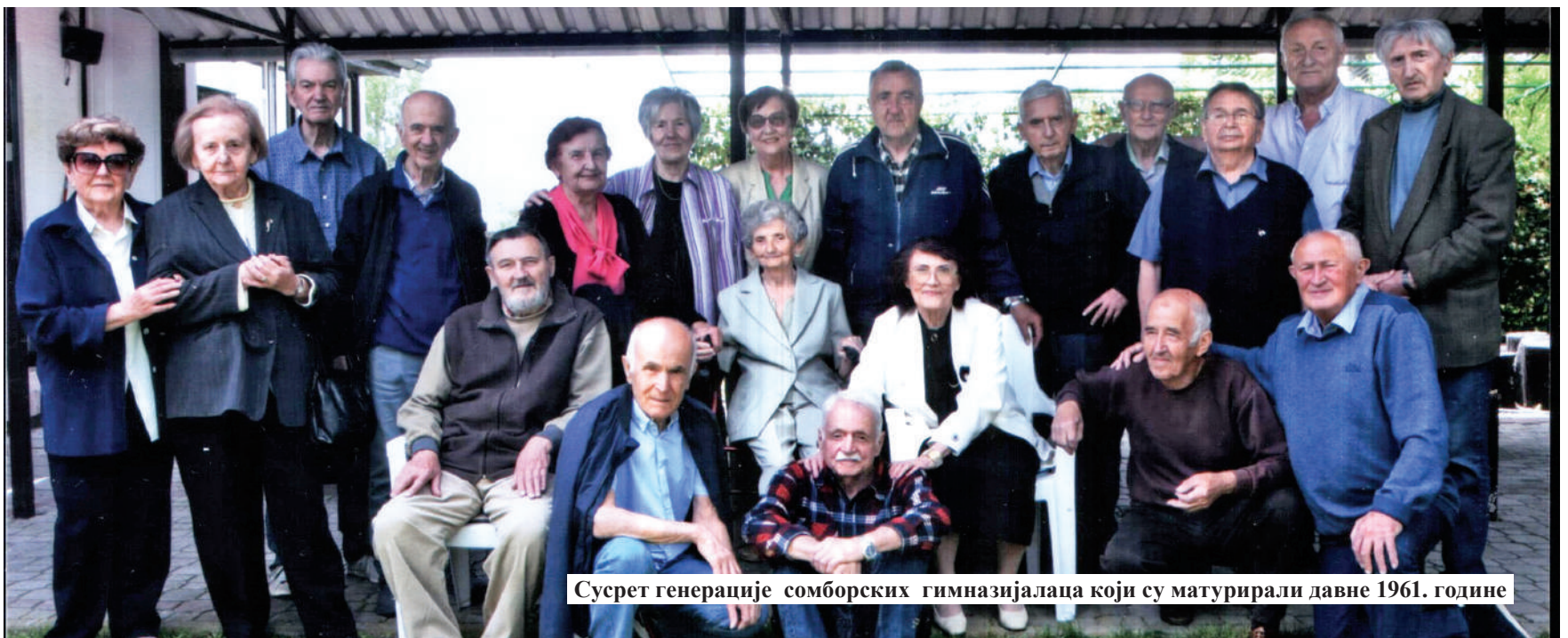
Сустрет генерације сомборских гимназијалаца који су матурирали давне 1961. године