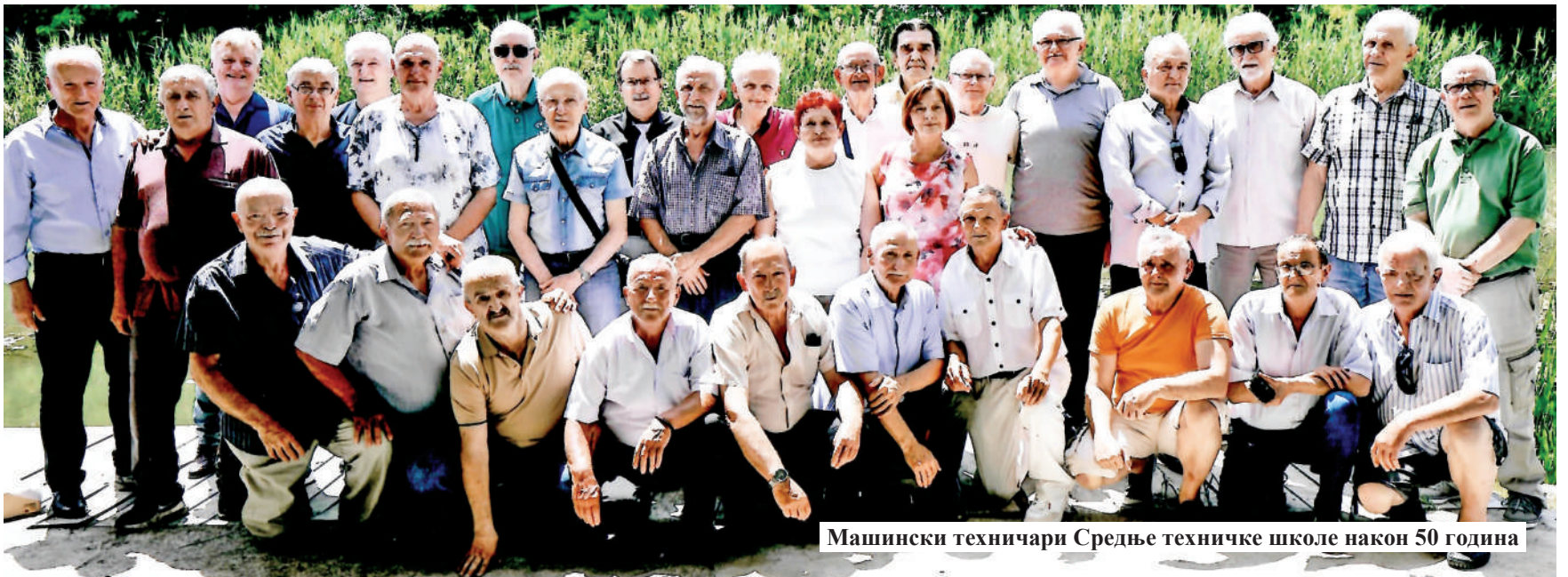
Машински техничари Средње техничке школе након 50 година