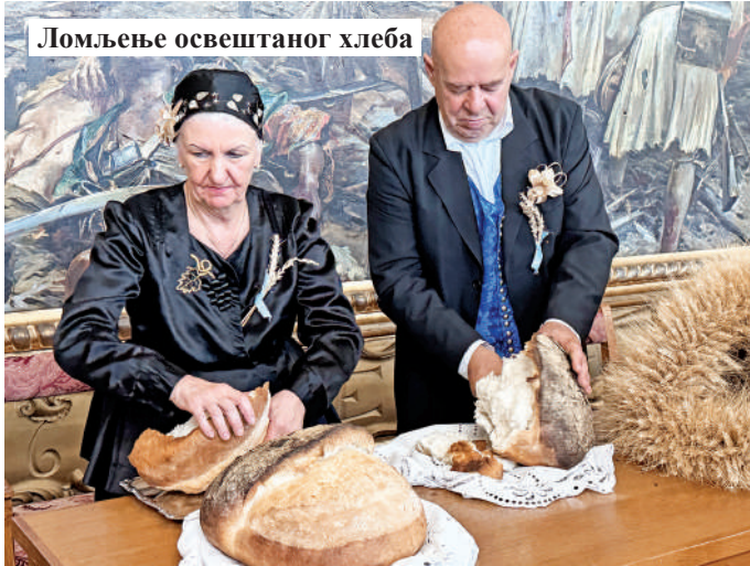
Ломљење освештаног хлеба

– У име нас Буњеваца и четири века нашег постојања на овој плодној равници, те у име наших делова и праделова и свих вредних ратара, али и у име дубоких бразда знојем на-