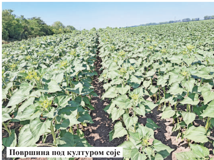
Површина под културом соје

Приликом визуелних прегледа у прегледаним усевима није утврђено присуство јаја кукурузне/памукове совице ( Хелицоверпа армигера ), али се због повољних временских услова у наредном периоду, очекује интензивно полагање јаја и пиљење ларви ове веома важне штеточине у усевима кукуруза.