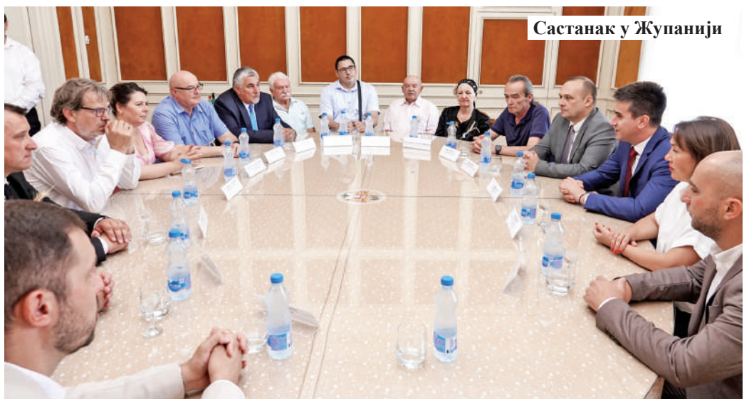
Састанак у Жупанији