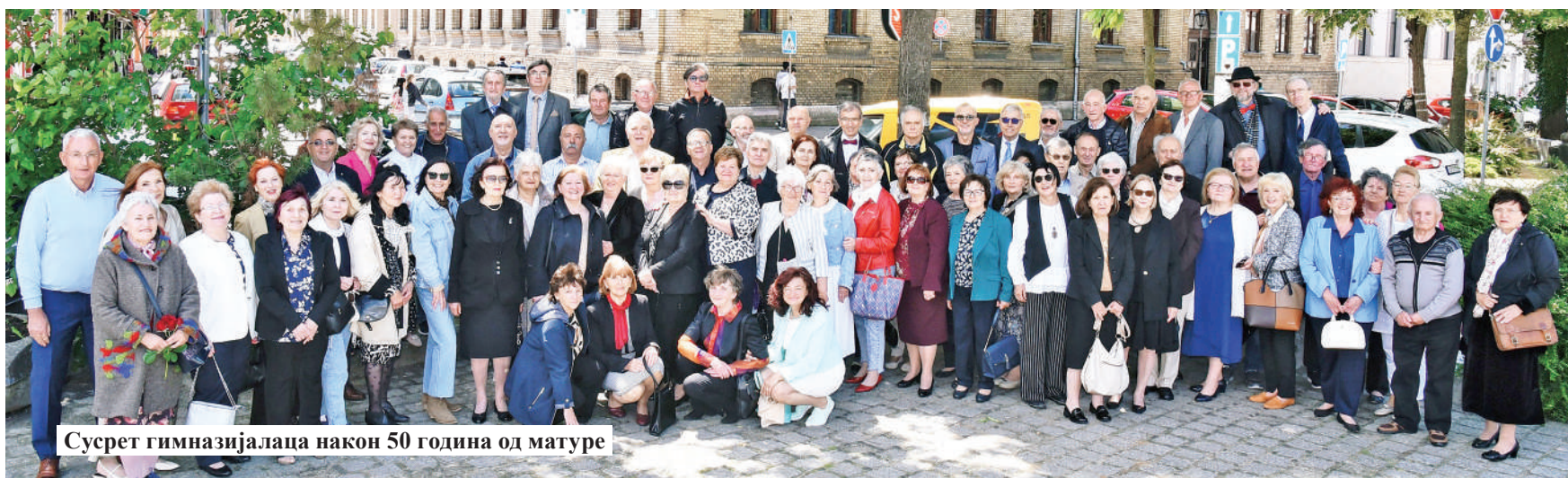
Сустрет гимназијалаца након 50 година од матуре